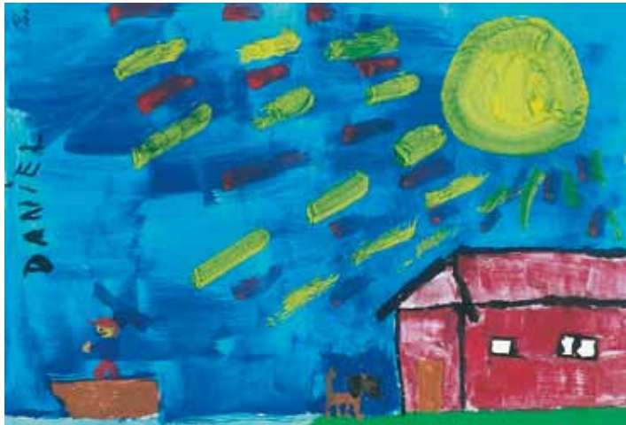
„Kleiner Mann geht mit dem Boot auf Reise“ (Junge 8 Jahre)

Schulkinder bis etwa neun Jahren zeigen ein eher sachliches Interesse am Tod und möchten oft gern mehr darüber erfahren. Sie wissen um die Endgültigkeit („ewiger Schlaf“) des Todes. Sie können Angst haben, verlassen zu werden, Angst vor dem Tod der Eltern. Bis zum zehnten Lebensjahr begreifen Kinder immer schneller und deutlicher, was Tod bedeutet.