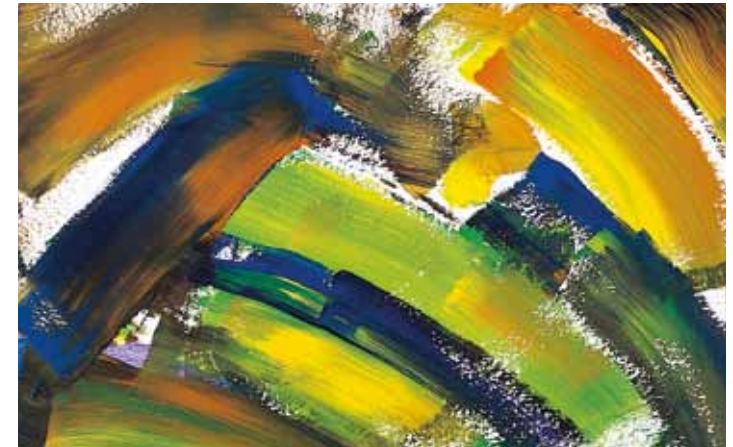
„Der zerbrochene Regenbogen“ (Mädchen 14 Jahre)

Die hierbei zugrunde liegenden ethischen Gesichtspunkte sind in einer Arbeitsgruppe „Ethik“ der Confederation of the European